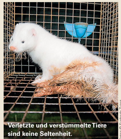
Verletzte und verstümmelte Tiere sind keine Seltenheit.

Die erforderlichen Angaben sind am Produkt selber anzubringen, und zwar entweder auf einer aufgeklebten oder anderweitig befestigten Etikette oder auf dem Preisschild. Gegenstand der Deklarationspflicht sind Erzeugnisse aus Fellen sämtlicher Säugetiere mit Ausnahme von domestizierten Tieren der Pferde-, Rinder-, Schweine-, Schaf- und Ziegengattung sowie von Lamas und Alpakas. Aufgrund einer Übergangsbestimmung müssen die Pelze allerdings erst ab März 2014 mit den entsprechenden Angaben versehen sein.