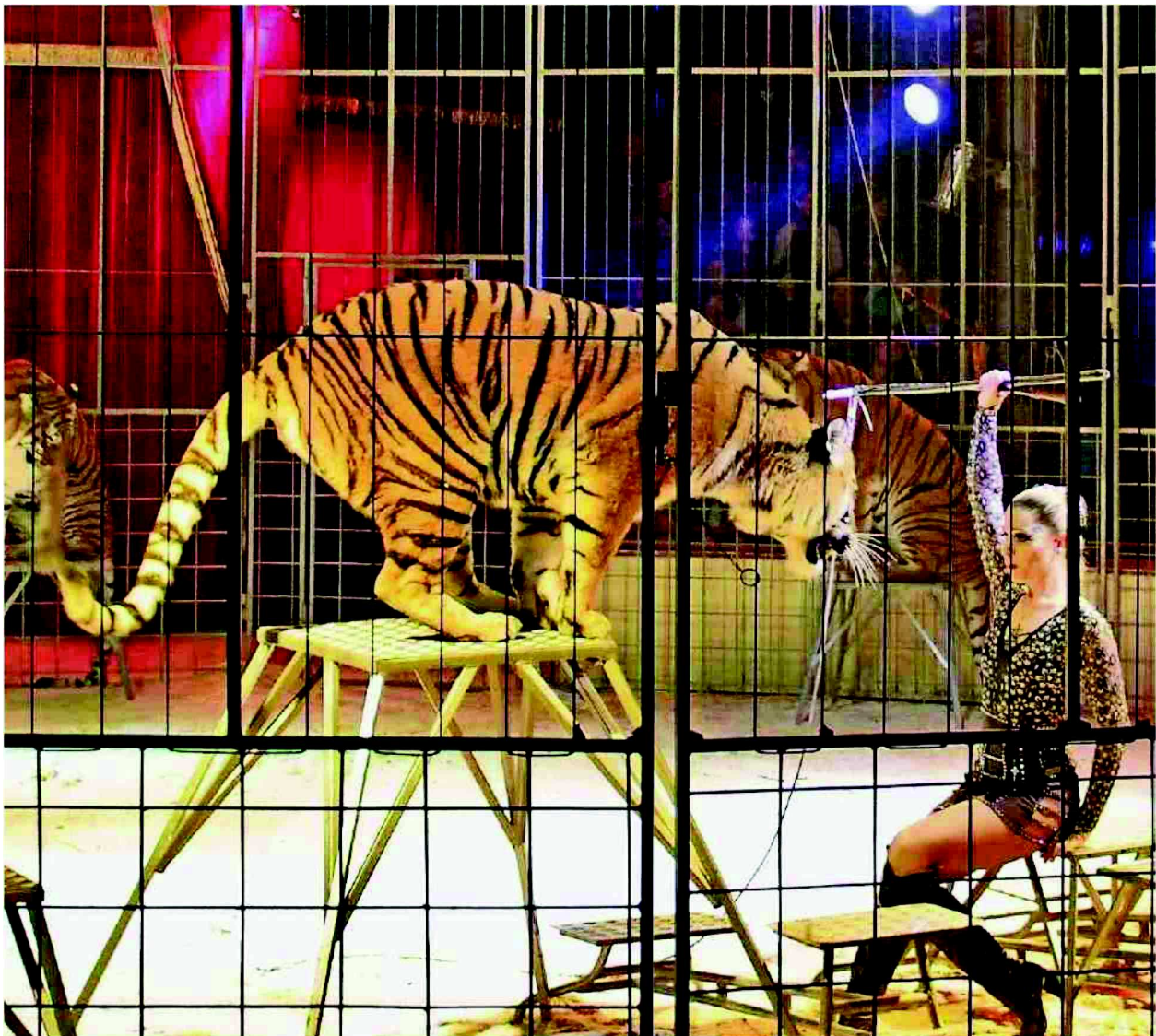
Wie schon in früheren Jahren will der Circus Royal nächstes Jahr wieder Raubtiere in die Manege holen.