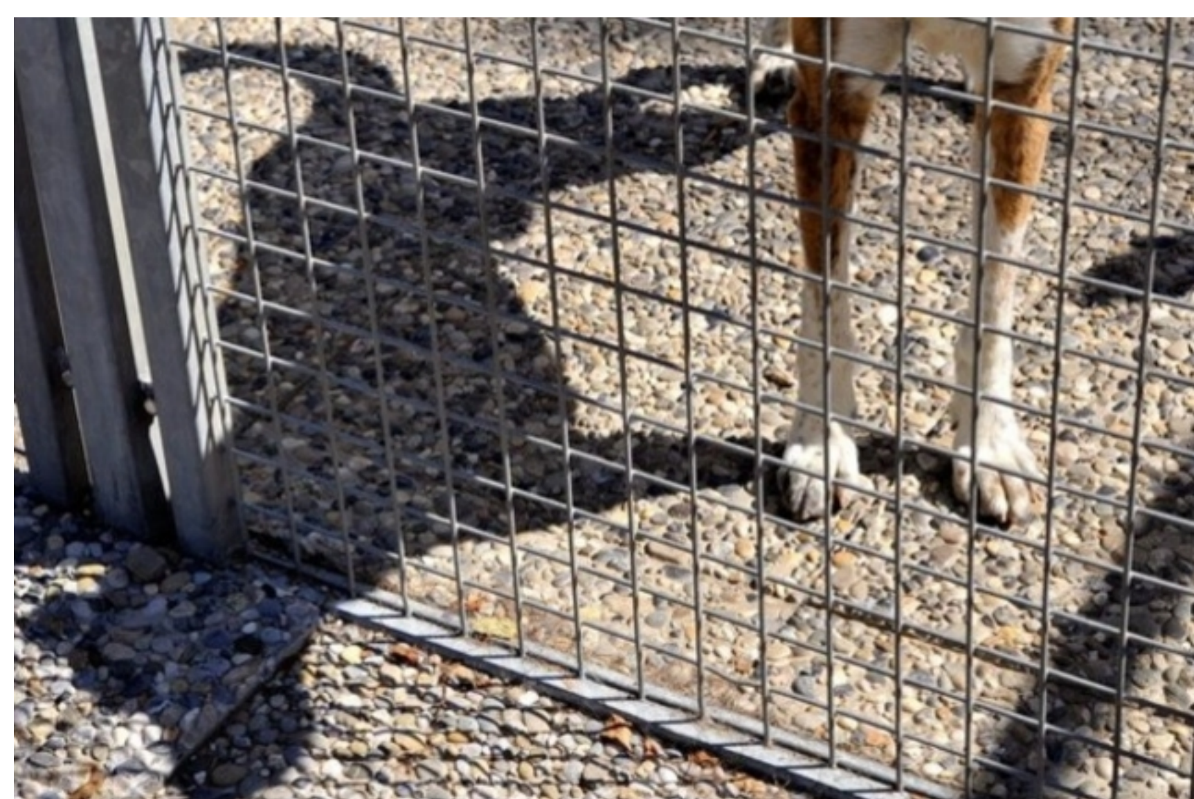
La majorité (50,4%) des infractions concerne des animaux de compagnie, principalement des chiens.

Maltraitance Le nombre de plaintes liées à de la maltraitance animale repart à la hausse. Selon la fondation alémanique Tier im Recht, la majorité des cas concerne des chiens.