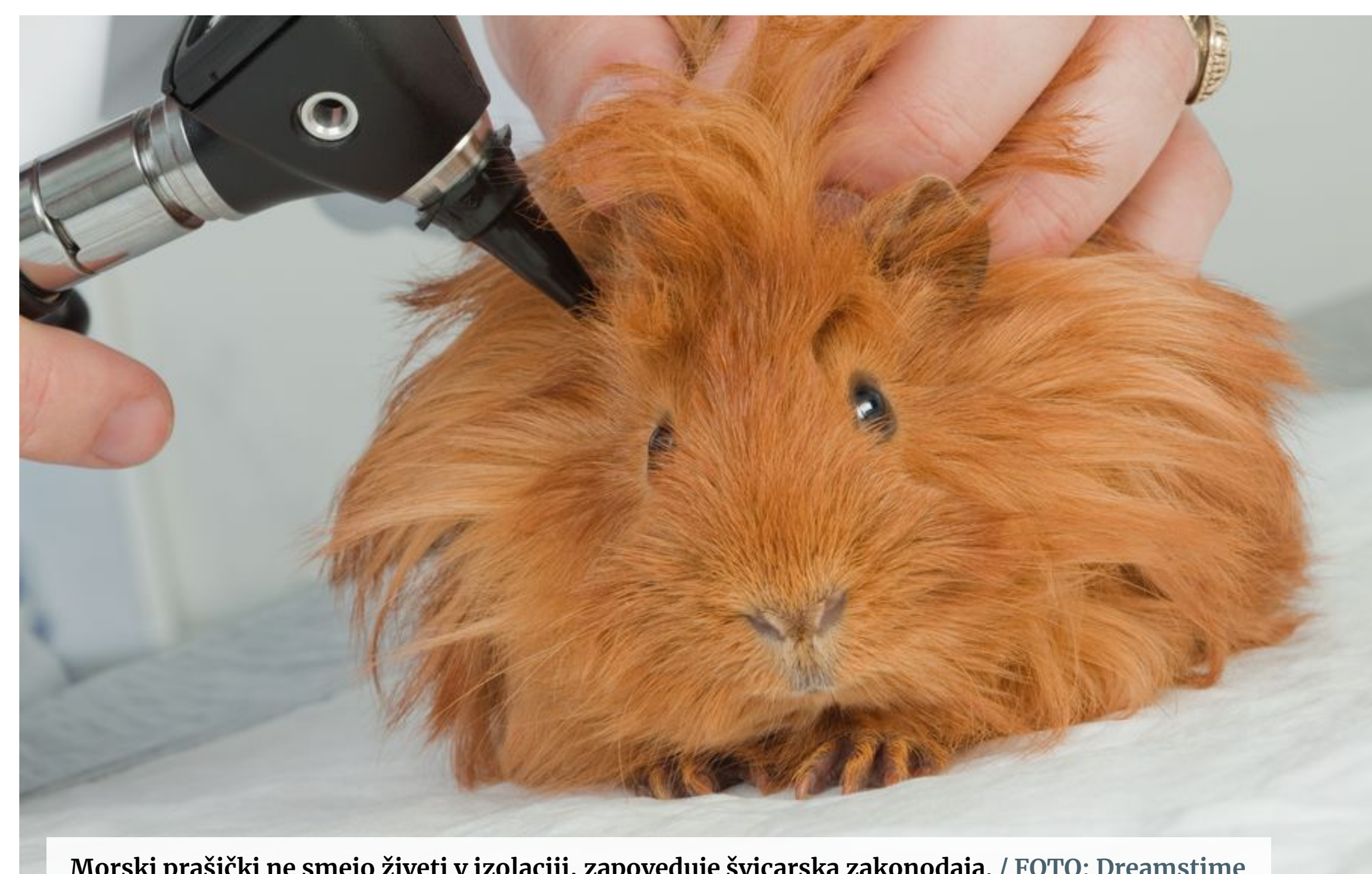
Morski prašički ne smejo živeti v izolaciji, zapoveduje švicarska zakonodaja.

Si predstavljate, da bi vas zaprlj v nek prostor, kjer ne bi imeli stika z drugimi ljudmi? Zelo hitro bi vaše zdravje začelo pešati, najprej seveda psihološko in duševno, posledično pa tudi splošno zdravje. Ljudje smo družbena bitja in potrebujemo stik z drugimi ljudmi. A pri tem nismo noben unikat – tudi številne živali namreč za svoj zdrav razvoj potrebujejo redne stike s primerki svoje vrste. Ne glede na to, koliko pozornosti namenjate svojemu domačemu ljubljencu, pa nekatere vrste potrebujejo tudi stik s sebi enakimi. Onemogočanje živalim, ki so po naravi družabne, druženje s "prijatelji" lastne vrste v Švici razumejo kot kršenje njihovih pravic in celo krutost do živali.