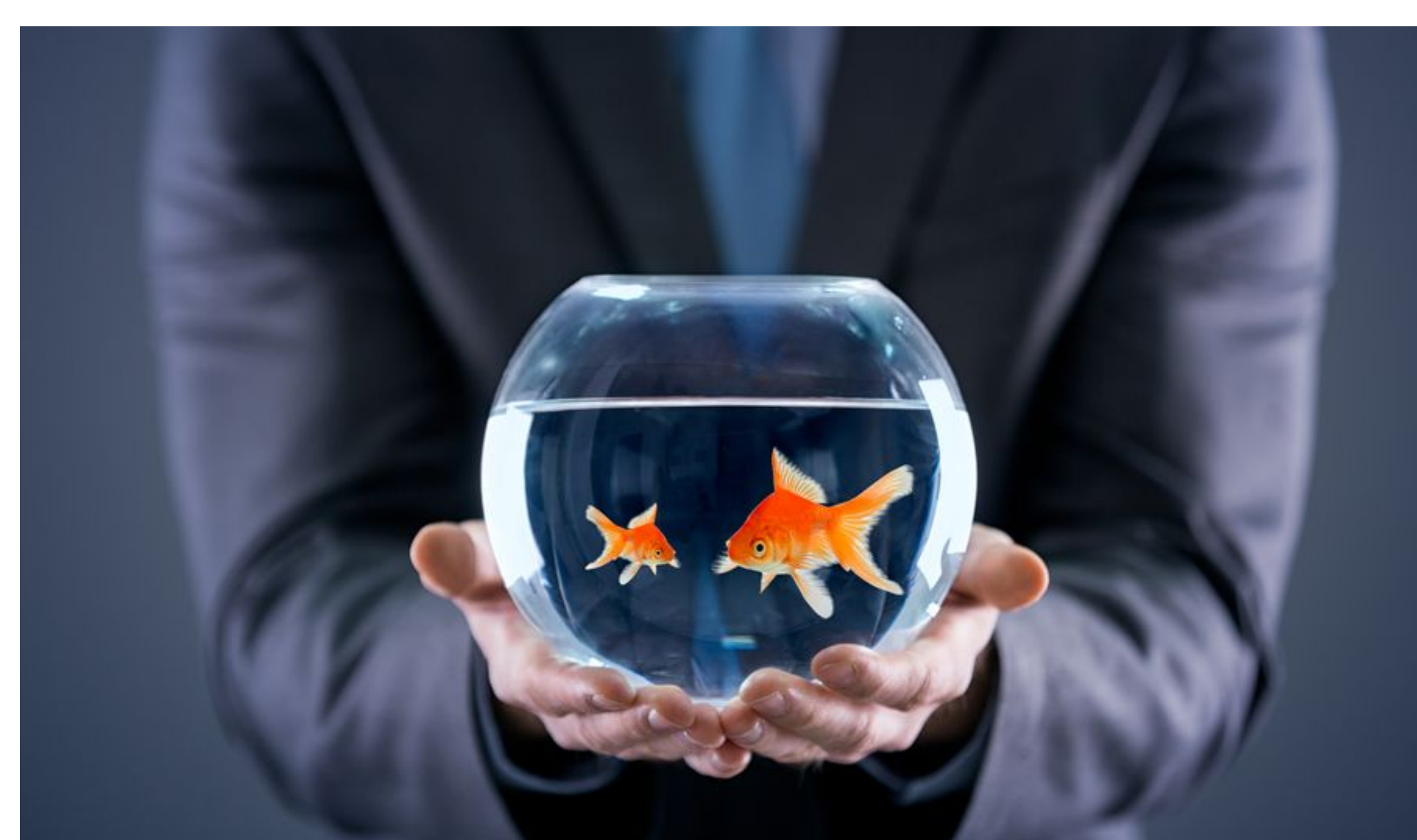
Zlate ribice spadajo med živali, ki morajo biti v paru ali skupini.

Organizacija Tier im Recht spremlja tudi vse sodne procese na področju zakonodaje o dobrobiti živali in vzdržuje bazo vseh odločb od leta 1981, ki jasno kaže, da Švica resno pristopa k tej problematiki. Med odločbami je tudi kar nekaj takšnih, ki se nanašajo na kršitve glede pravic o lastništvu družabnih vrst živali. Kazni za te kršitve pa so ponavadi denarne.