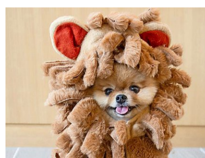
10, 6 Millionen Follower: Jiffpom

Frauchen bleiben anonym) in die Traumfabrik Los Angeles. Erste Erfolge feierte er im Sport: Jiffpom hält den Weltrekord im Sprint über zehn Meter auf den Hinterpfoten sowie über fünf Meter auf den Vorderpfoten. Das verhalf ihm zu einem Auftritt im Musikvideo «Dark Horse» der amerikanischen Sängerin Katy Perry . Seine Berühmtheit verdankt Jiffpom jedoch vor allem seinem Aussehen: Fotos im Bademantelchen oder im Löwenkostüm verzücken seine Fans.