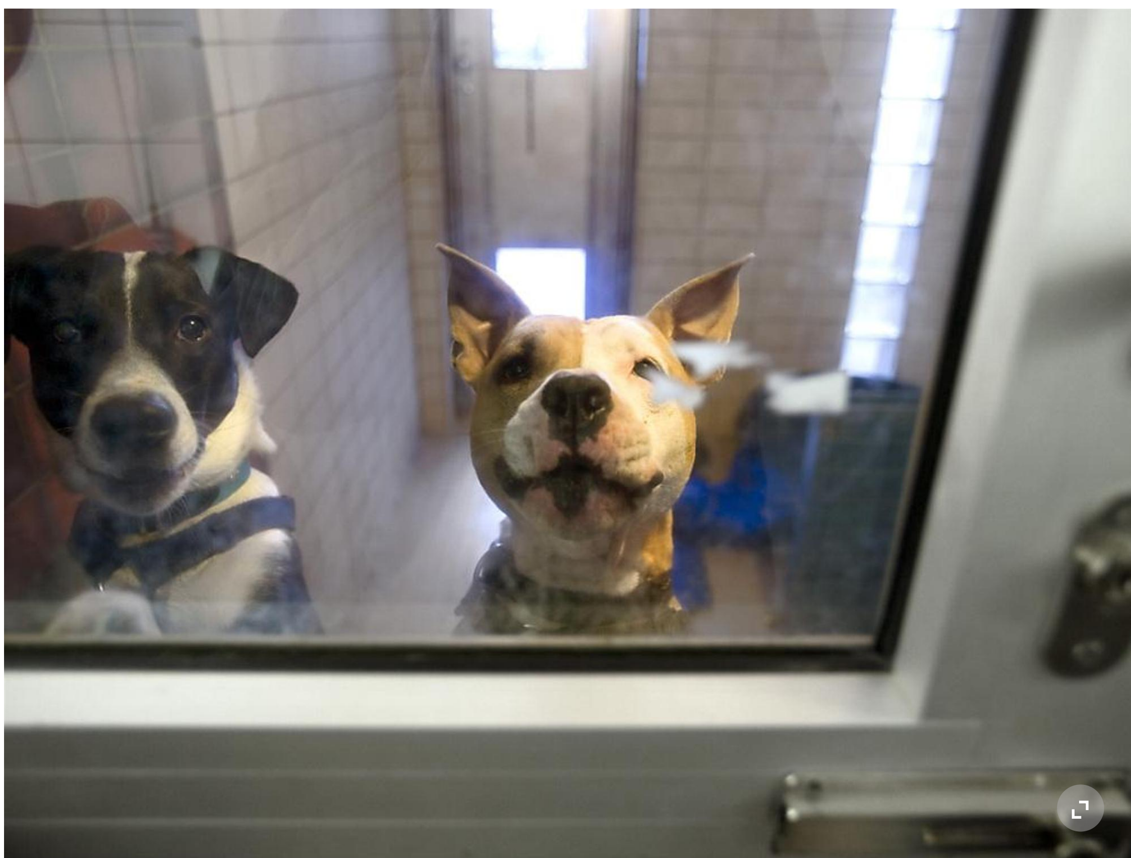
Herrenlose Hunde im Tierheim des Tierschutz Zürich: Hunde sind am meisten von Verstössen gegen das Tierschutzgesetz betroffen. (Archivbild)

2019 sind in der Schweiz 1933 Straftaten an Tieren juristisch beurteilt worden. Das sind 173 Fälle mehr als im Vorjahr. Die Stiftung für das Tier im Recht (TIR) geht aber von einer hohen Dunkelziffer aus. Hunde sind am meisten betroffen.