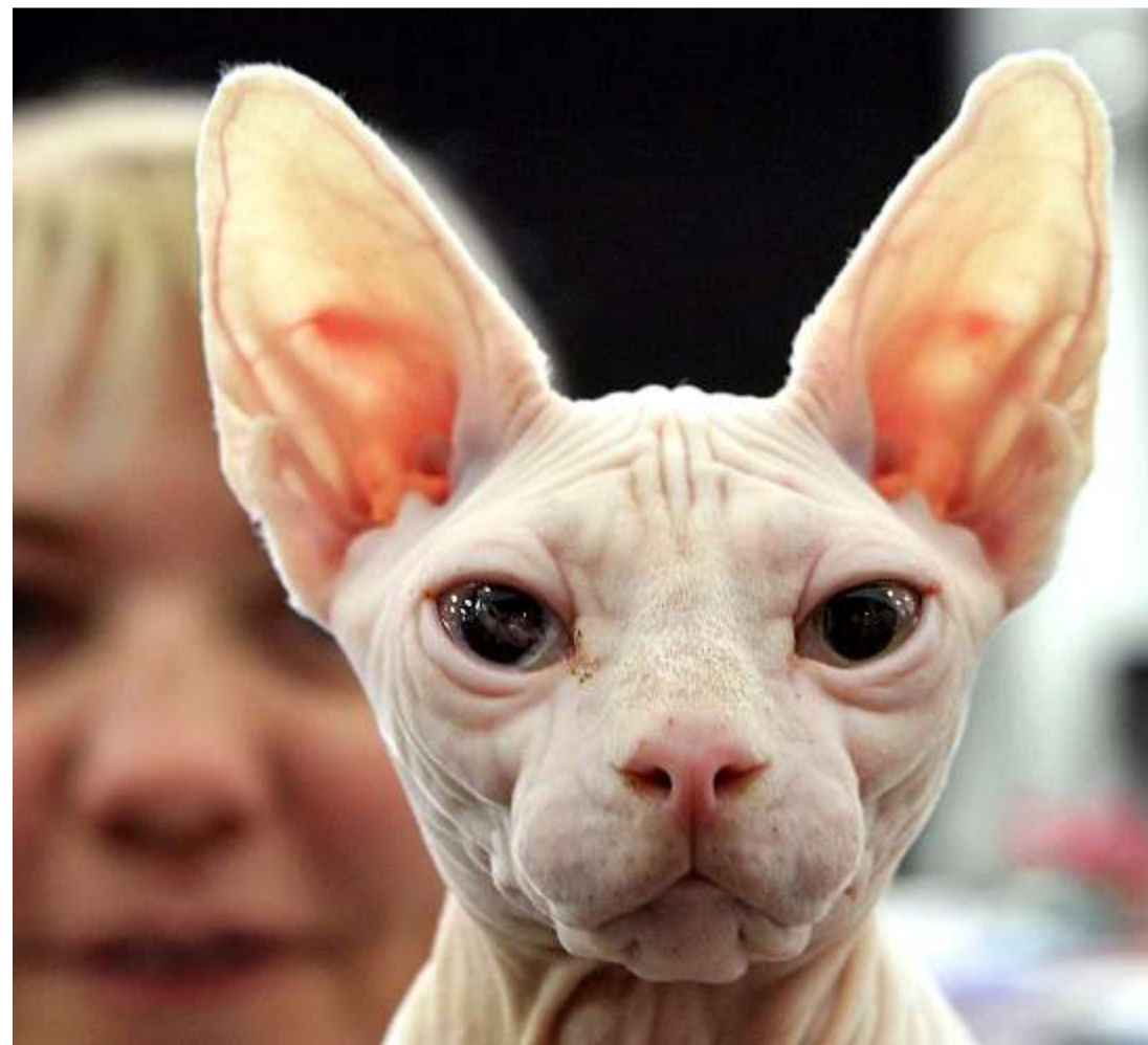
Eine kahle Katze: Sogenannte Qualzuchten sind in der Schweiz seit 2008 verboten.